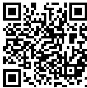
劉克襄數位主題館

劉克襄（1957年1月8日－），本名劉資愧，是詩人、小說家、自然觀察者、臺灣史旅行研究者，從年輕時代即常跋涉山水，透過旅行來觀察台灣土地的發展。年輕時以鳥類生態為主要關注題材，開啟台灣自然觀察寫作的風氣，因而有[鳥人]的稱號。劉克襄深耕自然寫作二十年，早期散文如《旅次札記》以詩般簡潔且知性的筆調，展現不濫情的生態省思。中期作品廣涉自然志，在《自然旅情》等書中援經據典，開創獨特的美學觀察模式。後則轉向實踐，透過《小綠山三部曲》至《快樂綠背包》，將自然觀察連結鄉土教學與社區運動；《山黃麻家書》則體現親子共學的理想。近年其動物小說更為台灣文學開啟新視窗。他兼容作家與環保者身份，是台灣自然寫作極具實驗精神的開拓者。從《風鳥皮諾查》到《永遠的信天翁》，作者透過動物小說呈現台灣三十年來的生態變遷與保育，向國際展現台灣的重要性，為台灣文學開拓出深厚的新內涵。而《 浩克慢遊 》節目（2014年至今，曾與 王浩一 共同主持），跨足影視，優質精彩亦頗受好評。