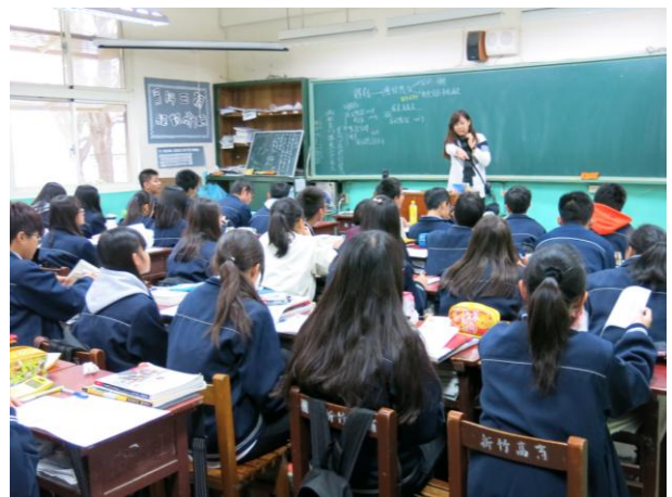
實用技能學程課堂教學