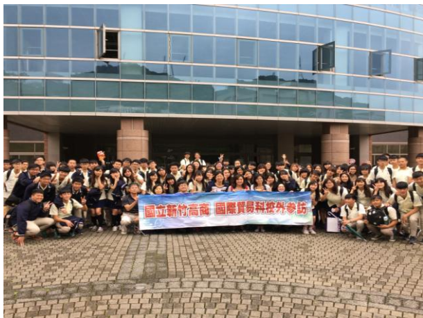
國際貿易科校外教學參訪