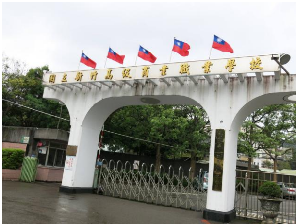
國立新竹高商校門(78 年校史 1940-2018)