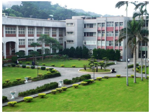
學校教學區中庭環境