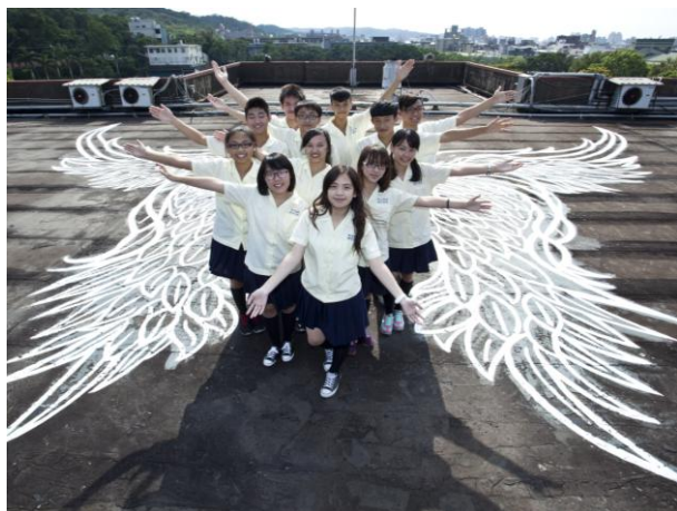
學校和平樓屋頂(我的少女時代電影場景)