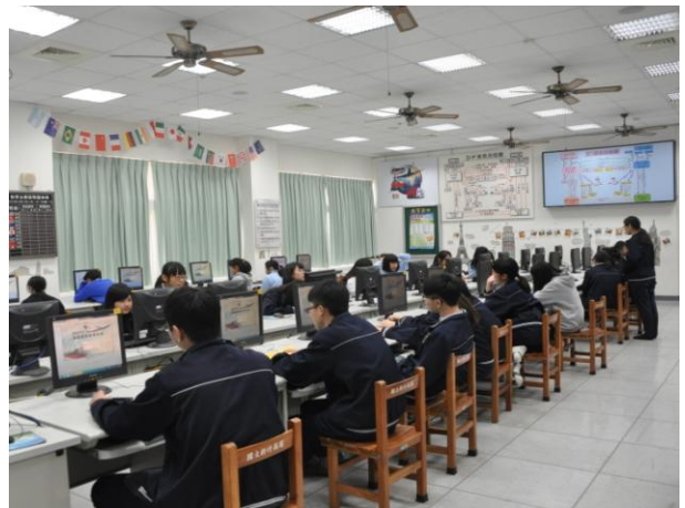
資料處理科電腦教室上課