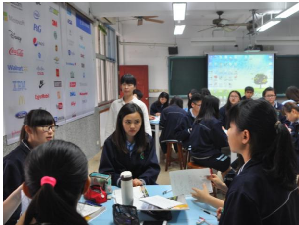
應用外語科英語導覽課程分組學習