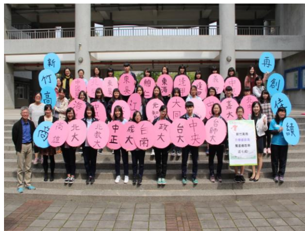
綜合高中大學繁星成績優異