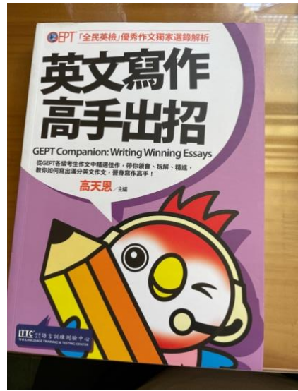
學習歷程相關 照片 (8張)