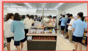
▲下課聚集了迫不及待要購買食物、飲品的學生。