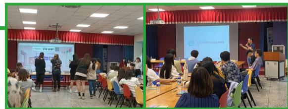
▲校長使用 Kahoot! 與師培學生互動、進行搶答。