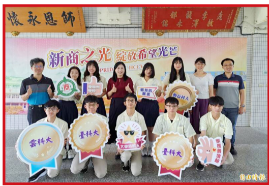
▲新竹高商今年在四技二專成績表現相當優異，有近 8 成學生錄取國立大學及科大，其中進臺科大的學生不少，學生表現優異。

112 學年度四技二專聯合登記分發今天放榜，新竹高商今年錄取台灣科技大學、臺北科技大學、臺北商業大學、雲林科技大學、高雄科技大學、臺中科技大學及彰化師範大學等多所國立大學及科技大學，約 79% 職高畢業生錄取國立學校，較去年成長約 9%，再刷新學校升學紀錄。