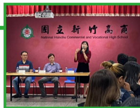
▲校長勉勵與祝福未來老師。

講座過程中，教務主任與校長皆示範了科技融入與活化教學，使用手機問答與搶答的方式與朝陽科技大學師培學生進行互動，從「心目中的新竹高商」開始投入今日講座，接著在分享國際教育推動時，由校內英語廣播作為素材進行搶答，體驗英語融入教學環境的真實現場。最後由校長致贈本校文宣小品，並且勉勵與祝福「未來的老師們」，對於即將進入的教育現場有所準備，抱持著謙虛的態度，提升自我能力，不斷地學習，才能在每一場的教師甄選，大放異彩。