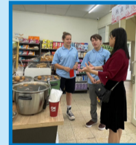
▲校長向交換生介紹營養又別具風味的茶葉蛋。