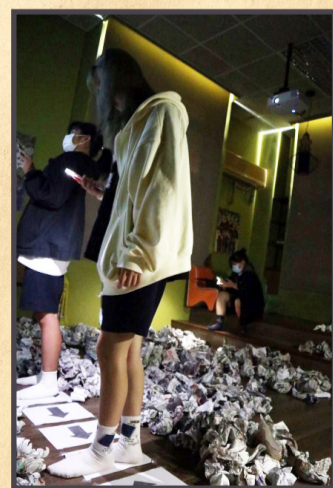
▲圖書館密室逃脫活動剪影。