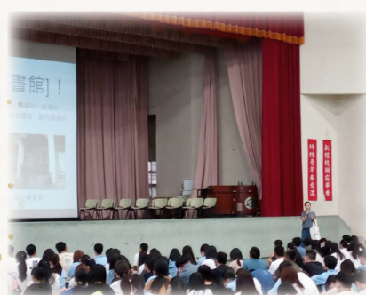
▲介紹資源豐富的圖書館

所以夢想的彼岸其實沒有那麼難到達，中間也許有很多擋在河面上的障礙或者是漂浮物，學會利用它們，又或者如何越過它們，才是最重要的。