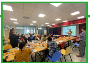
▲Q&A 時間，師培學生互動熱絡。